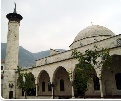
Habibi Neccar Camii